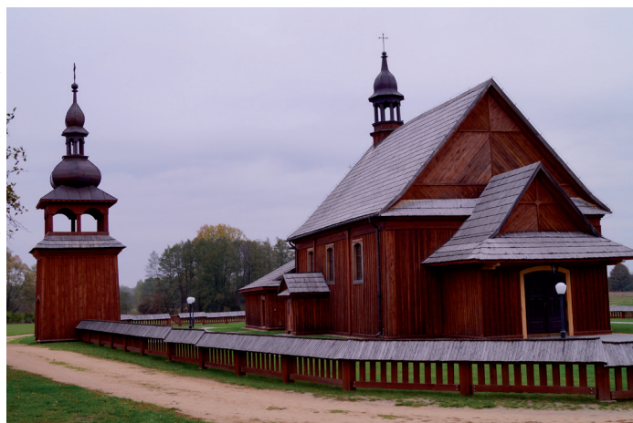
Drewniany kościółek postawiony w miejscu męczeństwa unitów w Pratulinie. W środku można zobaczyć m.in. fundamenty cerkwi unickiej, przed którą życie oddali bł. Wincenty Lewoniuk i jego towarzysze.