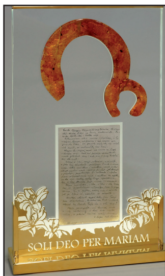
Relikwiarz bł. Stefana Wyszyńskiego