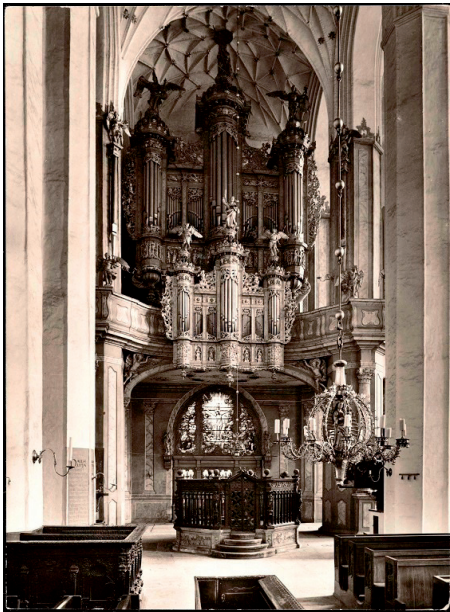
Były to najwspanialsze organy nad Bałtykiem