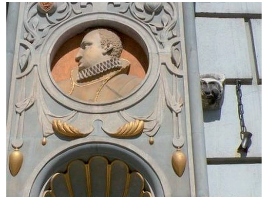
Czarci żąb po dziś dzień wisi na łańcuchu przy wejściu do Dworu Artusa.

Oboje wrócili do Gdańska, zabierając ze sobą swe „czarcie trofeum”. Ojciec Róży, wzruszony odwagą Wojtka i uwolnieniem córki z rąk szatana, zgodził się na ślub obojga.