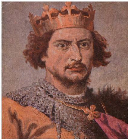
Król Bolesław II Śmiały

dziejach muzyki - znany nam z nazwiska kompozytor polski (również i poeta) - Wincenty z Kielczy. Był to pochodzący z rodziny rycerskiej na Opolszczyźnie dominikanin, kanonik krakowski i kapelan biskupa krakowskiego, Iwona Odrowąża.