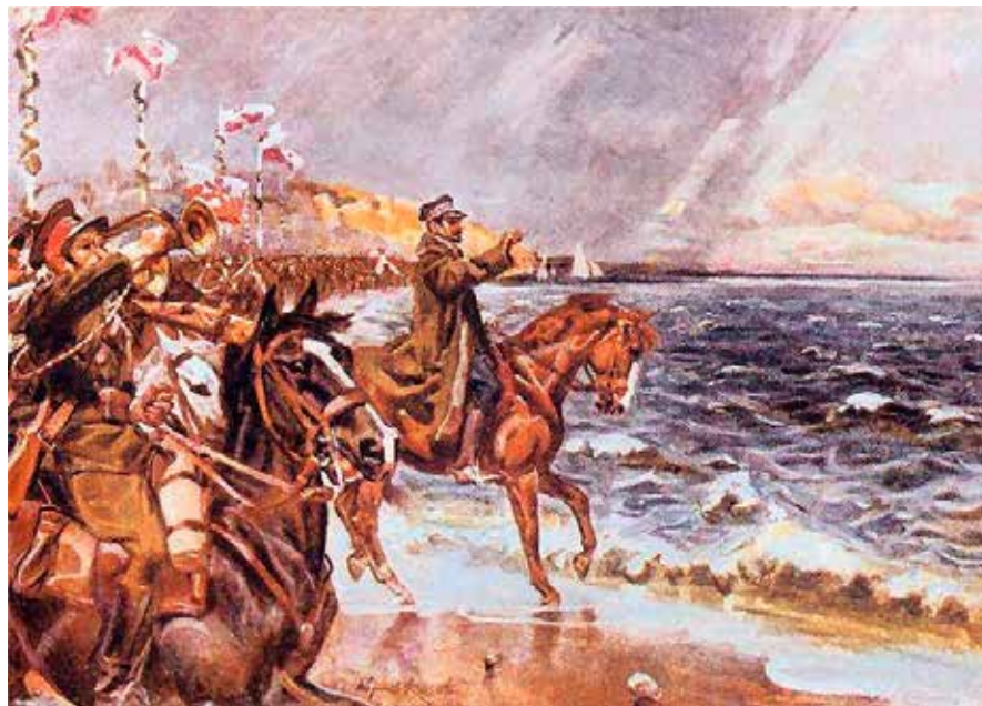
Moment zaślubin Polski z morzem w Pucku - 10 Luty 1920 r.