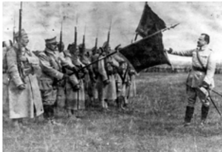
J. Haller przejmuje dowództwo nad Błękitną Armią

„błękitna”? Nazwa pochodzi od koloru umundurowania jej żołnierzy. Powstała ona dzięki decyzji prezydenta Francji Raymonda Poincaré, który zezwolił na tworzenie samodzielnych jednostek polskich na ziemi francuskiej. W skład „błękitnych” początkowo wchodził Polacy służący w armii francuskiej oraz ochotnicy, jeńcy z wojska austro-węgierskiego i niemieckiego oraz emigranci, m.in. ze Stanów Zjednoczonych.