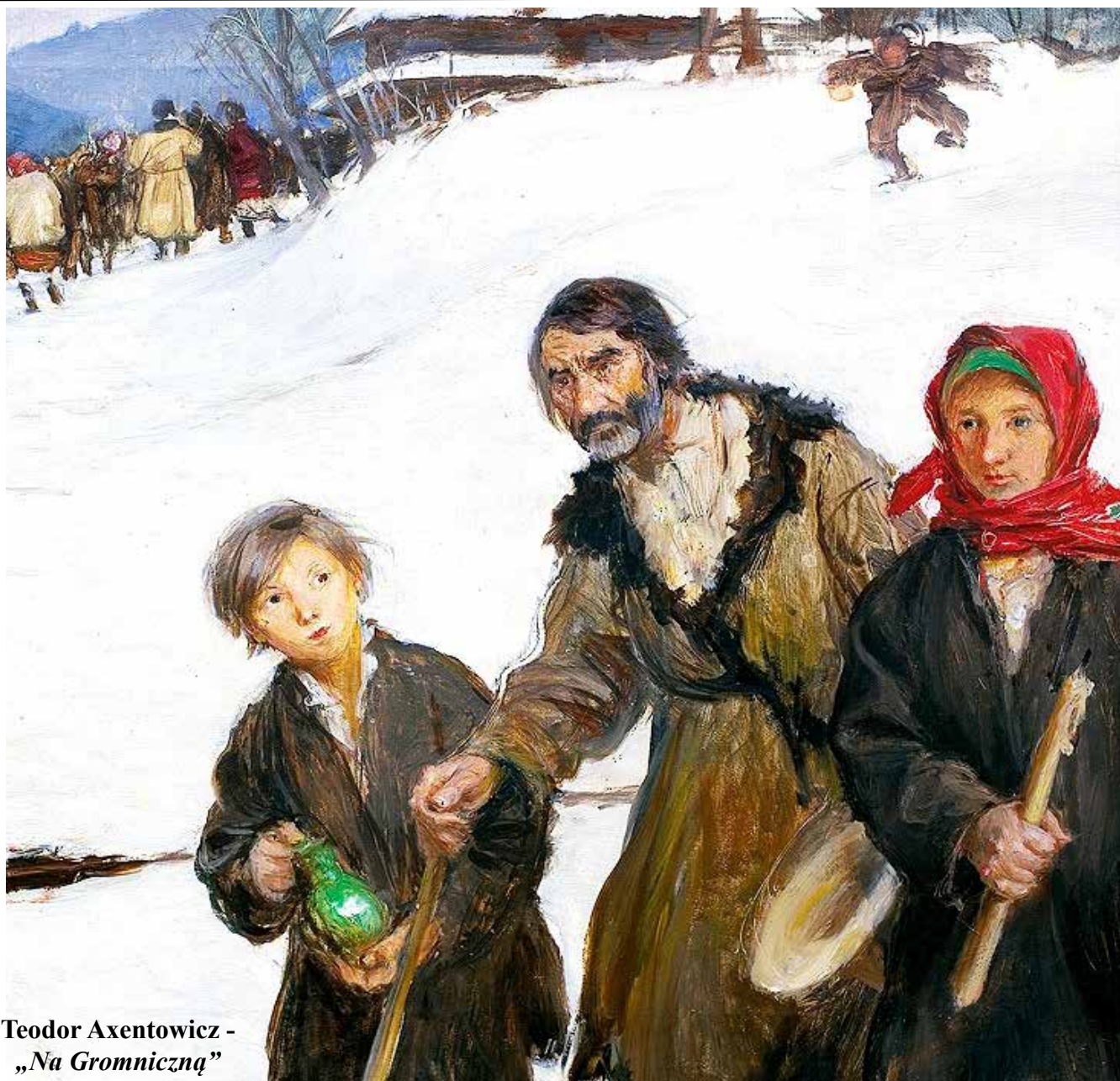
Teodor Axentowicz - „Na Gromniczną”

Duch, który umacnia miłość Dwuletni program duszpasterski 2017 - 2019