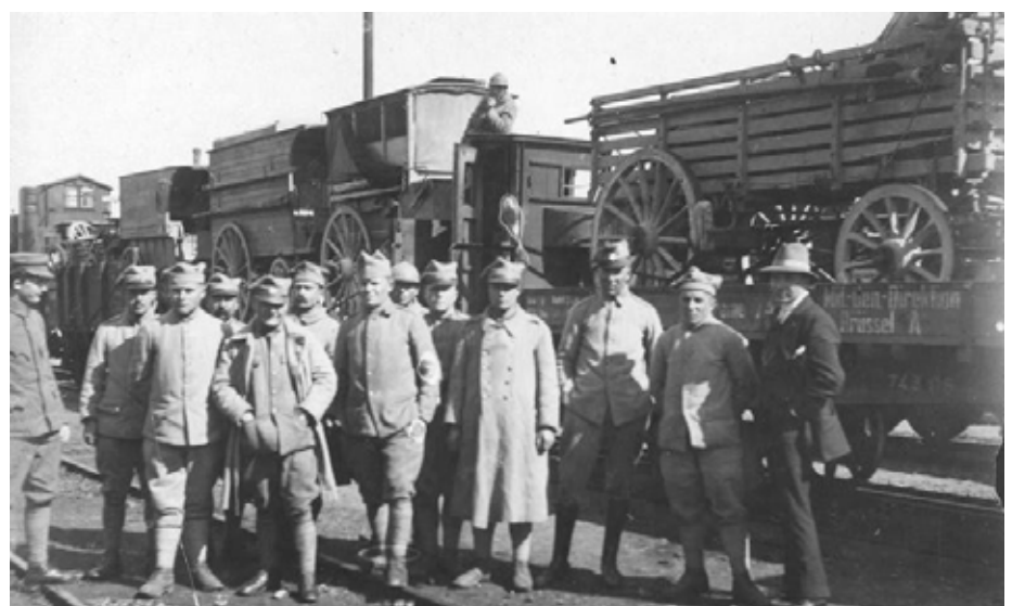
Żołnierze Błękitnej Armii podczas transportu do Polski

Kulminacyjnym elementem przejmowania ziem pomorskich miały być symboliczne zaślubiny Polski z morzem, którego miał do końca „błękitny generał” Haller. W drodze do jedyne go wówczas polskiego portu, jakim był Puck, generał zatrzymał się 10 lutego 1920 roku w Wolnym Mieście Gdańsku. Z rąk Józefa Wybickiego otrzymał tu dwa pierścienie, przekazane przez