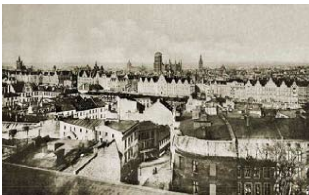
zabudowa Biskupiej Górki

W 1772 r. nastąpiło ostateczne przejście Biskupiej Górki przez władze Gdańska (bez uzgodnienia z biskupem) i włączenie jej w obszar miejskiej jurysdykcji. Opadające w kierunku Kanału Raduni stoki Biskupiej Górki były zabudowywane co najmniej od XVI w. Kształtujące się przedmieście określano aż do XIX wieku nazwą „Czarne Morze” (Schwarzes Meer) od nazwy znajdującego się tu niewielkiego „oczka” wodnego. W 1762 r. wzdłuż