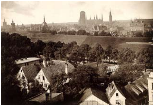
Widok na Gdańsk z Biskupiej Górki - 1890 r.

Okres wakacji to czas letnich wyjazdów, bowiem według niektórych aby odpocząć trzeba wyjechać. Popularne niegdyś wyjazdy nad Morze Czarne, obecnie ze względów finansowych i politycznych nie dla wszystkich są dostępne. Dla tych, którzy pozostali w mieście proponuję podróż przez historię nad gdańskie Morze Czarne.