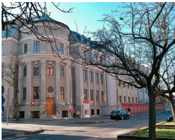
Włocławek - Dom generalny Sióstr Wspólnej Pracy od Niepokalanej Maryi,

Po skończeniu szkoły powszechnej, wbrew planom mamy i starszego rodzeństwa (tato już nie żył), zapragnęłam kontynuować edukację w szkole średniej we Włocławku. Dzięki cici udało mi się pokonać piętrzące się trudności i zamieszkać przy klasztorze Sióstr Wspólnej Pracy od Niepokalanej Maryi, ponieważ szkoła nie posiadała internatu. Tam przez cztery lata doznałam wiele serca od sióstr i mogłam konsekwentnie rozwijać swoje powołanie. Z