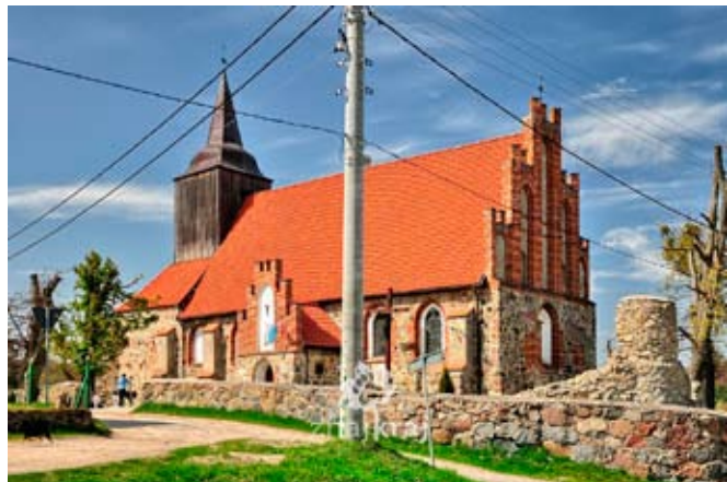
Kościół p.w. Bożego Ciała w Pręgowie

Zdaniem bractwa Opatrzności Bożej było pomnażanie czynnej miłości Boga i bliźniego, szerzenie świętej wiary katolickiej, doskonalenie własne i innych w dążeniu do zbawienia, gorące i nabożne uwielbienie, adorowanie Opatrzności Bożej oraz wykonywanie następujących zobowiązań: czcić Opatrzność Boską w ćwiczeniu się w uczynkach miłosiernych co do duszy i co do ciała, w czasie doświadczeń nie narzekać ale wszystko oddawać woli Bożej, w uroczystości i niedziele brackie odpustami uhonorowane odbyć spowiedź i przyjąć Komunię