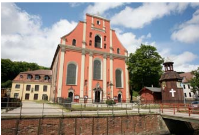
Kościół św. Ignacego Loyoli w Gdańsku

św. Opiekę nad bractwem sprawował proboszcz, który był zarazem ojcem duchowym bractwa. Bractwa Opatrzności Bożej istniały przy kościołach w Rumi, Pręgowie i przy kościele św. Ignacego na Oruni (Starych Szkotach).