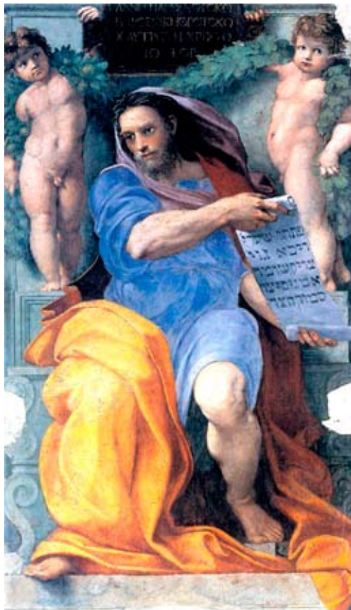
Prorok Izajasz - czy Ajzaja?

Nie zawsze jednak tak było. Pamiętam książki, a zwłaszcza podręczniki z czasów, gdy chodziłem do szkoły podstawowej, a więc z lat sześćdziesiątych ubiegłego wieku. Występował w nich np. Michał Anioł (nie Michelangelo) Buonarroti, Izaak (nie zaś Isaac) Newton, Karol (nie Charles) Dickens czy też Błażej (nie Blaise) Pascal. I chyba przynajmniej w