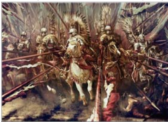
Bóg, Honor, Ojczyzna.

Nawiedzenie cmentarza jest też okazją, by na nowo odkryć prawdę o znaczeniu wiary, która upodmiotowi przeżywanie tego typu doświadczeń, także o niezwykłej więzi, jaką pozwala utrzymać modlitwa w intencji zmarłych. To modlitwa, a nie kwiaty czy licznie stawiane znicze daje możliwość zachowania intymnej,