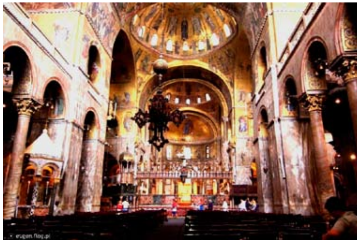
Wenecja - wnętrze Bazyliki św. Marka

Gomberta do przewycięzania techniki cantus firmus w dawnym znaczeniu. Nie oznacza to jednak całkowitej rezygnacji z chorałowego cantus firmus. Gombert wykorzystuje melodie chorałowe traktując je jako materiał struktur imitacyjnych w ramach przeimitowania.