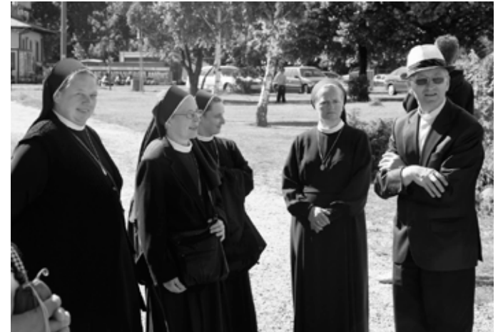
Igraszki i zabawy odbywały się bez cenzury?!