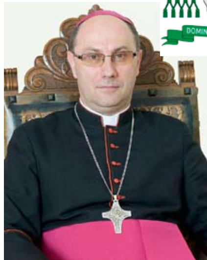
Prymas Polski - Wojciech Polak

Komentując tę nominację podkreślano, że nowy prymas Polski jest najmłodszy spośród wszystkich kiedykolwiek obejmujących ten urząd – a także jednym z najmłodszych ordynariuszy w polskim Kościele: 19 grudnia br. skończy 50 lat. To zaś oznacza, że – o ile nie zajdą jakieś nieprzewidziane okoliczności – będzie prymasem przez co najmniej ćwierć wieku. Tym samym dobiegnie końca swoisty „okres przejściowy” związany ze zmianą struktury organizacyjnej Kościoła