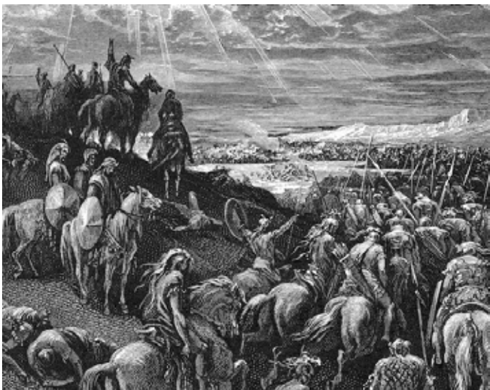
Gustave Dore, „Jozue wstrzymuje Słońce”

b) Druga faza: umotywować własne wojsko, ukazując cel. Zanim Izraelici weszli do Kanaanu, Jozue już namalował w wyobraźni i pragnieniach przyzwoyczajonych do pustyni nomadów tę tak cudowną ziemię. Zapewnił ich, że chodzi o najpiękniejszą krainę, jakiej dotąd nigdy nie widzieli: użyźnioną przez rzeki, bogatą w źródła wodne, drzewa owocowe, mleko i miód. Następnie dał im spróbować jej owoców, by poczuli wewnątrz siebie smak tej ziemi i aby nosili ją w sobie. Ten, kto nie wie o co walczy, nie znajdzie dość siły, żeby pokonać przeciwności i stawić czoła problemom. Innymi słowy, Jozue dał Izraelitom motywację, aby byli zdolni podjąć czekającą ich zbrojną konfrontację. Za tę ziemię opływającą w mleko i miód, której owoców już spróbowali, warto było zapłacić każdą cenę. Mieć