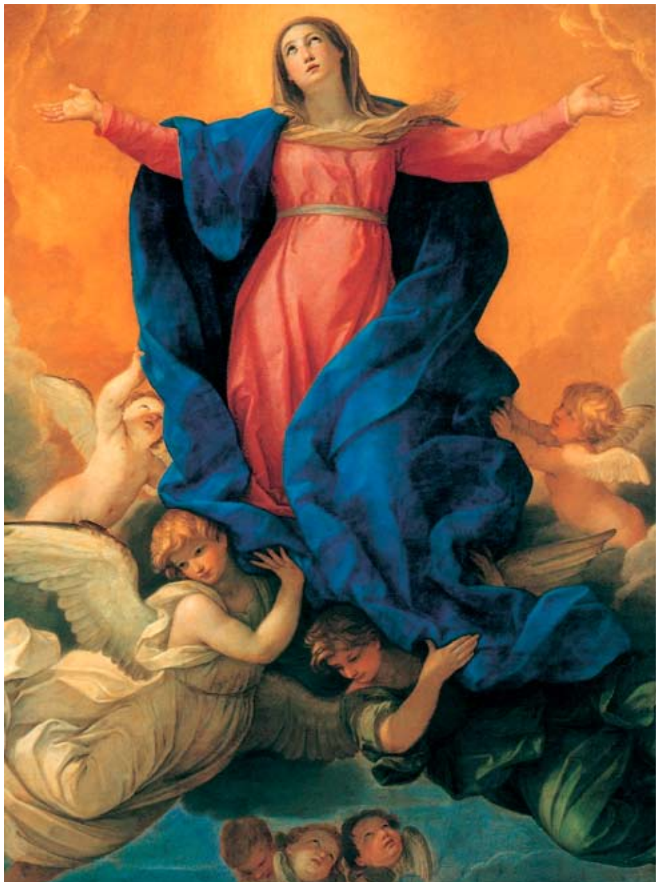
„Wniebowzięcie Najświętszej Maryi Panny „- GUIDO RENI

Orędzie Ojca Świętego Jana Pawła II do młodzieży całego świata z okazji XIII Światowych Dni Młodzieży (1997)