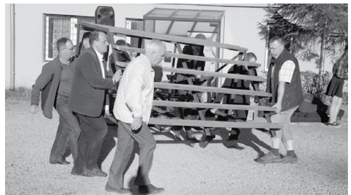
Wszystko co dobre ...