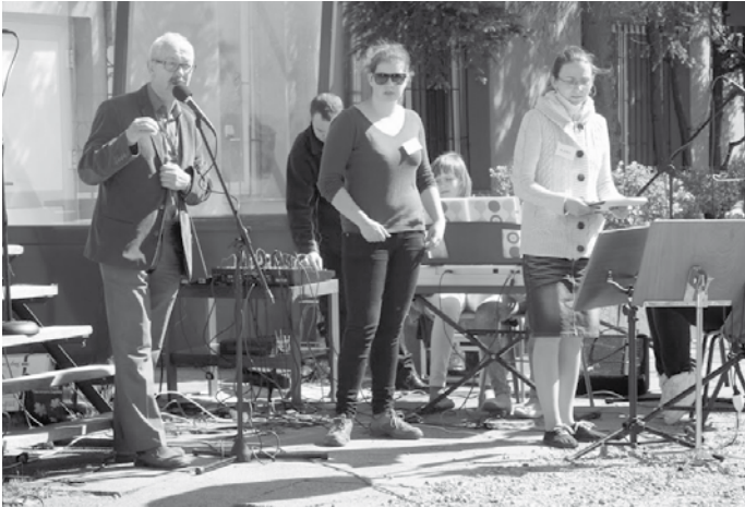
Festyn został otwarty, co przyjęte zostało z entuzjazmem