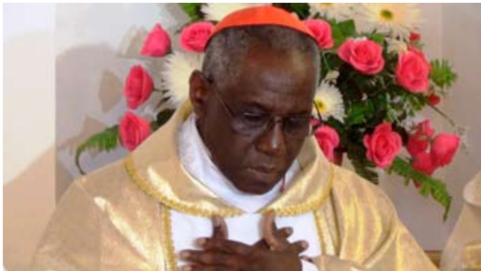
Kardynał Sarah przewodniczy uroczystej Mszy