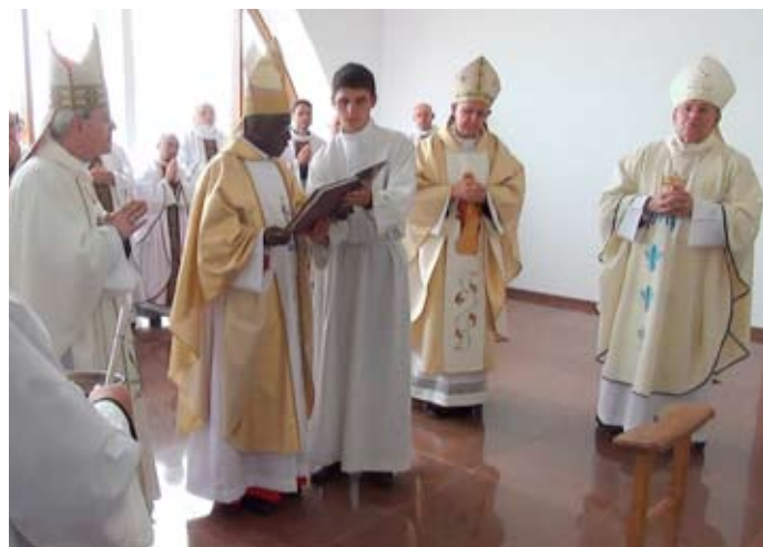
poświęcenie kaplicy przez kardynała

- To Matka Boża wskazuje na Chrystusa, który jest światłością świata, źródłem prawdziwego pokoju – podkreślił. - Oziornoje – dodał – jest miejscem przesiąkniętym modlitwą, dlatego też do tego miejsca trafił