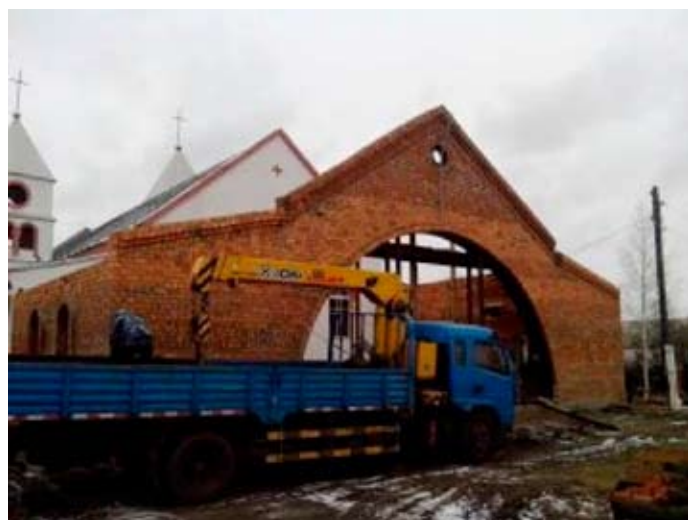
Budowa i - poniżej - makieta kaplicy w Oziornoje

Po powrocie z Rzymu, napełnianie modlitwą tego przysłowiowego naczynia w kościołach na terenie Polski trwało do lipca 2013 r. Wówczas ołtarz przewieziony został do stolicy Kazachstanu, Astany. Przez cały rok wierni przychodzący do archikatedry astańskiej modlili się w intencji pokoju i szczęśliwego przewiezienia do miejsca przeznaczenia. Tymczasem Oziornoje przygotowywało się do przyjęcia tego wyjątkowego daru. Najważniejszym zadaniem była budowa specjalnej kaplicy.