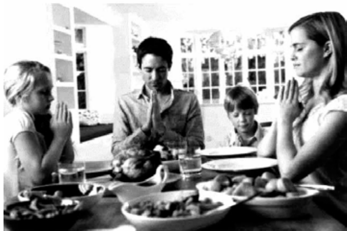
Modlitwa przed posiłkiem

Jednakże rzeczywistość współczesnego świata każe zrewidować takie myślenie, gdyż coraz więcej wokół nas jest neopogaństwa, filozofii kreujących religijny chaos, któremu poddaje się wielu ludzi, uważających się za katolików, by nagle zdać sobie sprawę z tego, że przestrzeń