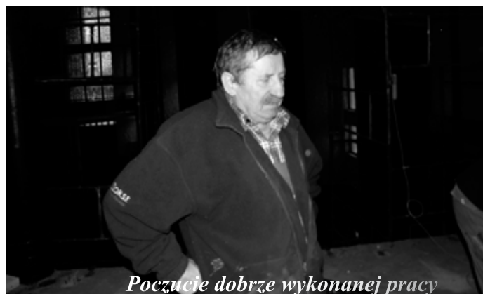
Poczucie dobrze wykonanej pracy