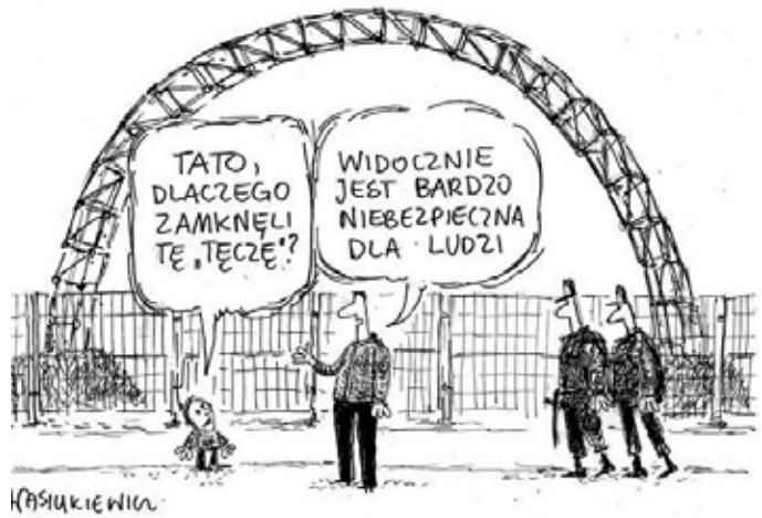
WASIUKIEWICZ Życiowe doświadczenie podpowiada...