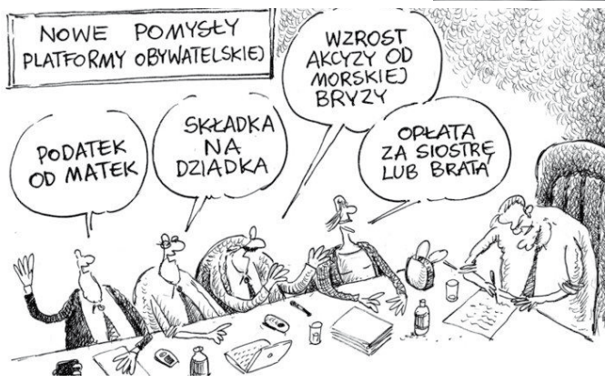
WASIUKIEWICZ A jednak się kręcił