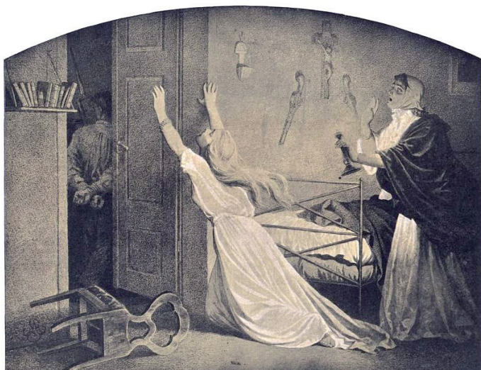
„Branka - Artura Grotgera