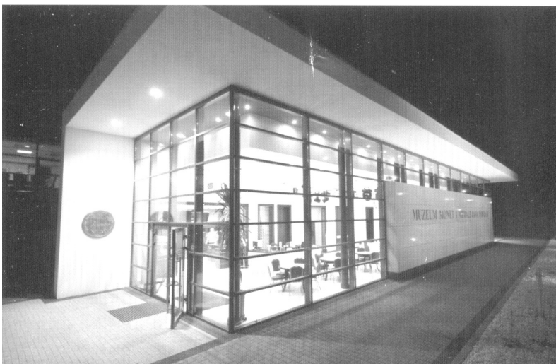
MUZEUM MONET I MEDALI JANA PAWŁA II

Bardzo interesujący jest zbiór znaczków pocztowych, zdjęć oraz obrazów z Janem Pawłem II.