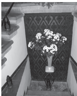
Drzwi do krypty