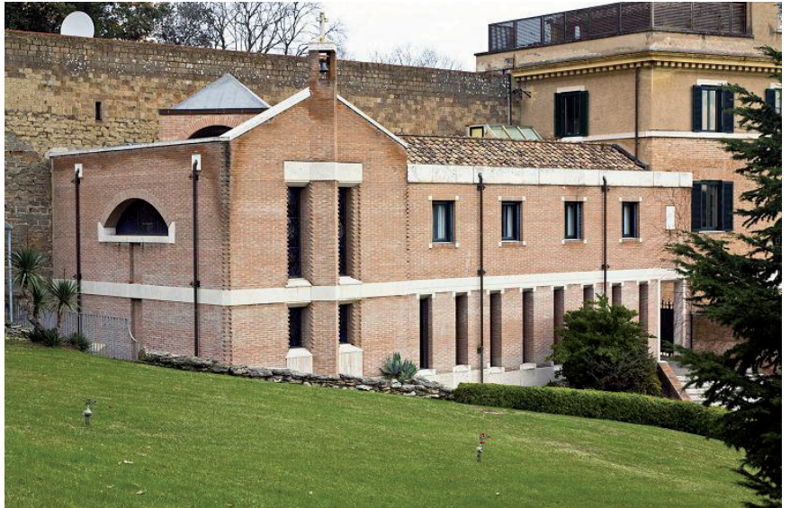
Klasztor Mater Ecclesiae - w którym zamieszka Benedykt XVI po abdykacji.

do emerytury, a Polak – do śmierci”. W tym też duchu jeden z uczestników dyskusji w programie katolickiej redakcji TVP1 „Między ziemią a niebem” w ubiegłą niedzielę najpierw zarzucił komentatorom, że z jednakową gorliwością potrafią uzasadnić tak decyzję Jana Pawła II o pełnieniu swej posługi do końca, jak i abdykację jego następcy. Z wyraźną pretensją do Benedykta XVI stwierdził