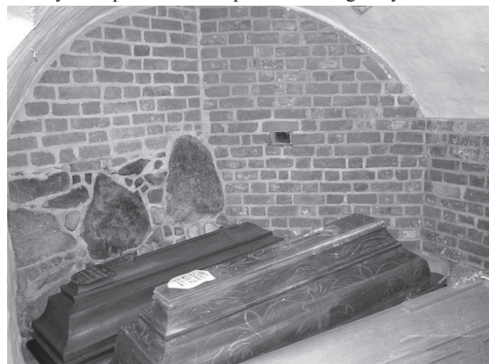
Krypta biskupów gdańskich